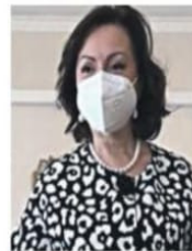
Il prefetto di Isernia Gabriella Faramondi

Si tratta di una responsabilità sociale e diffusa - rimarca il Prefetto - che richiede il contributo di tutti, nell'ottica di contemporaneamente esigendo la tutela della salute pubblica con la necessità di non rallentare il processo di ripresa in atto».